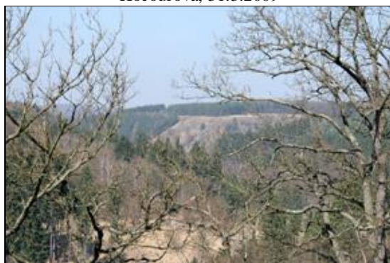
Obr. 32. Lánská obora, 31.3.2009. Pohled z vrchu Kocourová na svahy nad Klíčavskými luhy