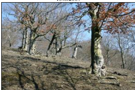
Obr. 3. Lánská obora, Vlčina, 31.3.2009