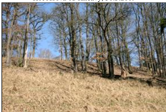
Obr. 31. Lánská obora, les u Sv. Alžběty, 31.3.2009