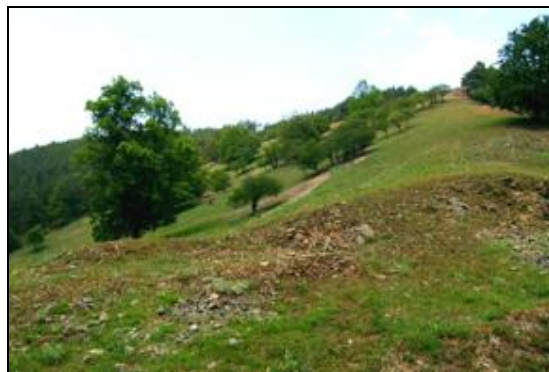
Obr. 2. Lánská obora, 13.6.2007. Teplomilná stráň nad Klíčovskými luhy