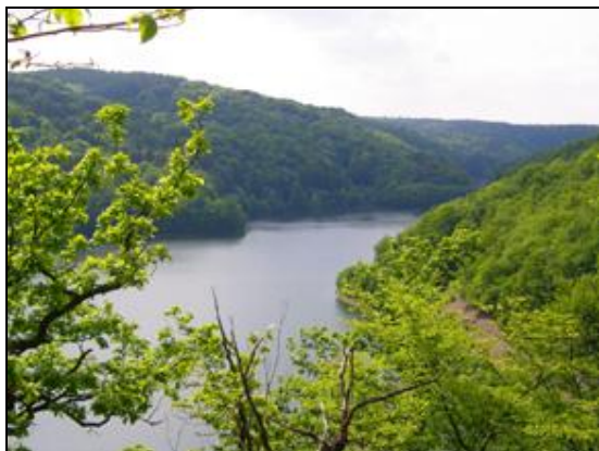
Obr. 9. Lánská obora, vodní nádrž Klíčava, 25.5.2008