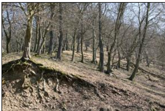
Obr. 29. Lánská obora, pohled na svahy vrchu Kocourová od Klíčavy, 31.3.2009