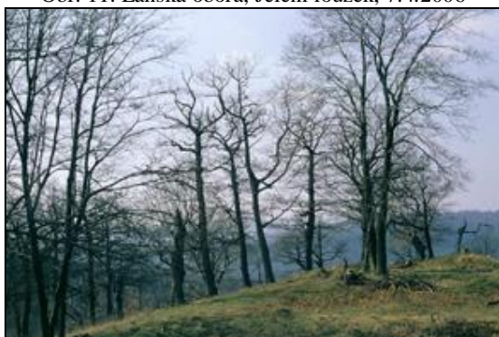
Obr. 13. Lánská obora, Jelení loužek, 7.4.2006