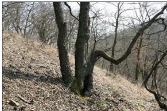
Obr. 48. Roztoky, NPR Stříbrný luh, 4.4.2009