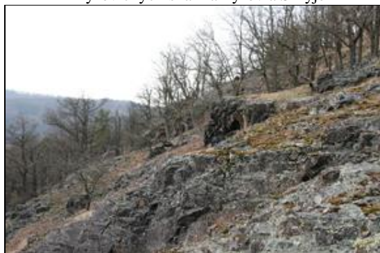
Obr. 44. Branov, NPR Velká Pleš, jihozápadní svah, 30.3.2009