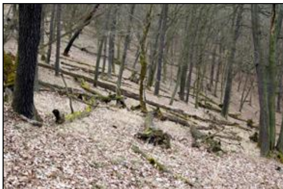
Obr. 41. Karlova Ves, NPR Týřov, les na hřbetu nad Týřovickými skalami, 30.3.2009