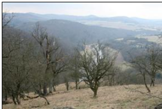
Obr. 42. Karlova Ves, NPR Týřov, 30.3.2009. Pohled z Týřovických skal na Týřov a Skryje