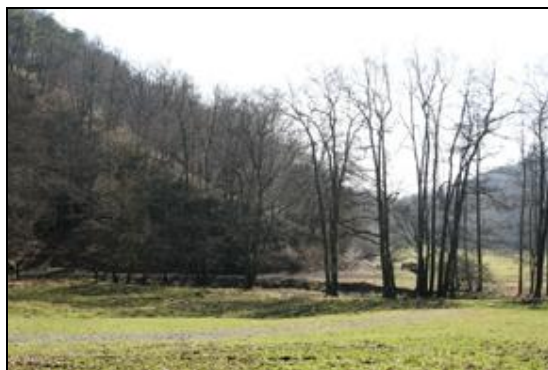
Obr. 30. Lánská obora, údolí Klíčavy pod vrchem Kocourová, 31.3.2009