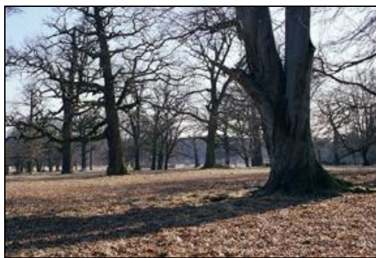
Obr. 36. Lánská obora, U Červené kůlny, 19.3.2003