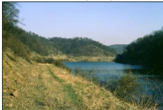
Obr. 8. Lánská obora, 1.4.1997. Pohled od západu na vodní nádrž Klíčavu