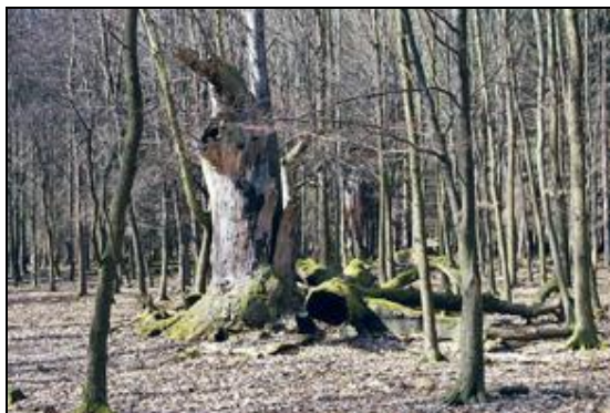
Obr. 25. Lánská obora, Liščina, 19.3.2003. Torzo dubu uprostřed plantáže dubů červených