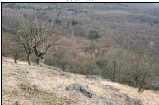
Obr. 45. Branov, NPR Velká Pleš, jihozápadní svah, 30.3.2009