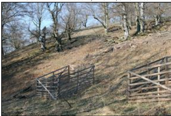
Obr. 6. Lánská obora, Vlčina, 31.3.2009