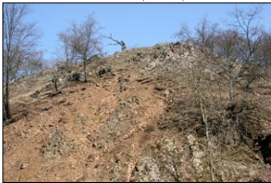
Obr. 7. Lánská obora, 31.3.2009. Suťový les západně od rybníka U Ručiček