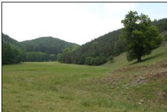
Obr. 1. Lánská obora, Klíčavské luhy, niva Klíčavy, 13.6.2007