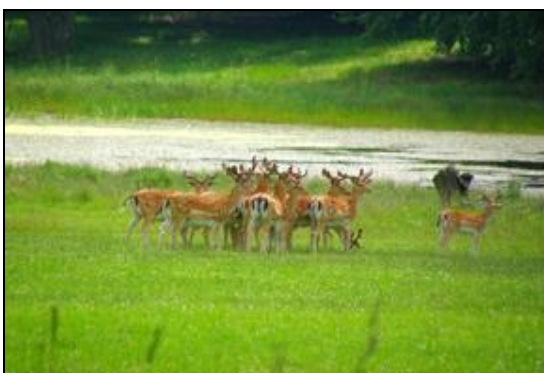
Obr. 38. Lánská obora, Kougľův rybník, 21.6.2009