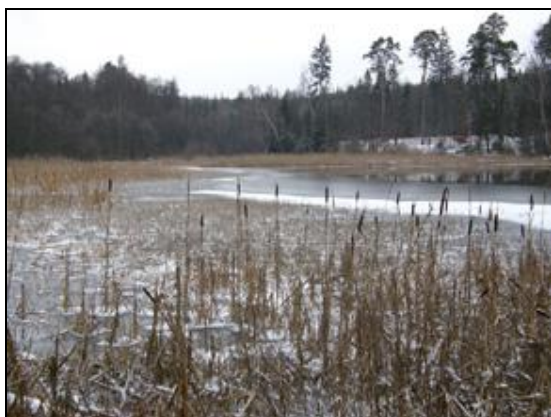
Obr. 15. Ruda, rybník Horní Kracle, 13.12.2009