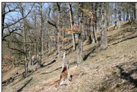
Obr. 28. Lánská obora, vrch Kocourová, 31.3.2009