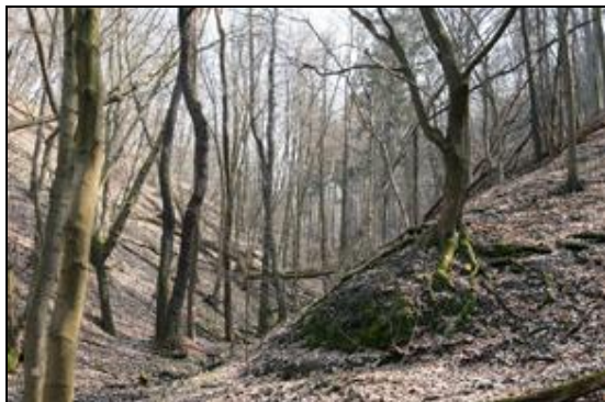
Obr. 47. Roztoky, NPR Stříbrný luh, 4.4.2009