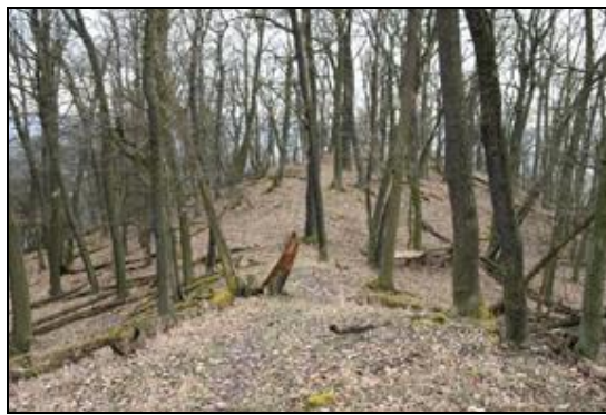
Obr. 40. Karlova Ves, NPR Týřov, les na hřbetu nad Týřovickými skalami, 30.3.2009