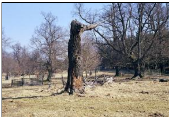
Obr. 21. Lánská obora, Myší díra, 7.4.2006. Torzo dubu s požerky tesaříka obrovského ( Cerambyx cerdo )