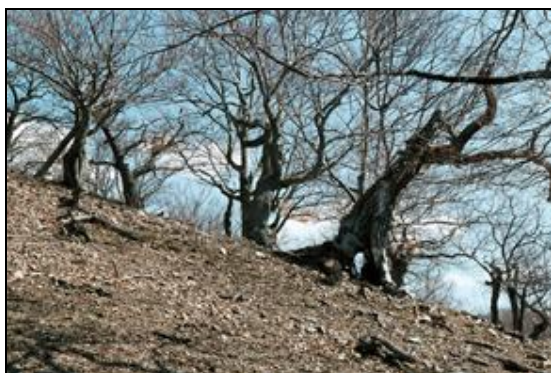
Obr. 11. Lánská obora, Jelení loužek, 7.4.2006