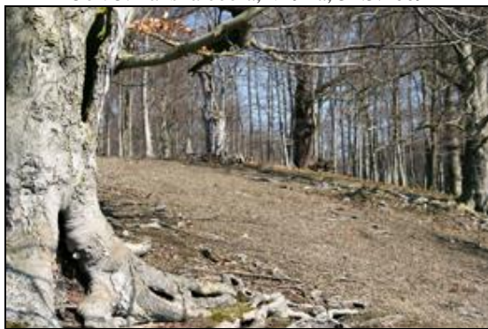
Obr. 5. Lánská obora, Vlčina, 31.3.2009