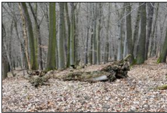
Obr. 39. Karlova Ves, NPR Týřov, les na hřbetu nad Týřovickými skalami, 30.3.2009