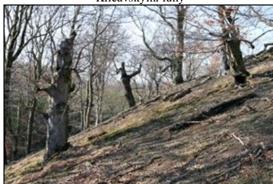
Obr. 4. Lánská obora, Vlčina, 31.3.2009