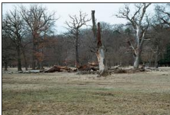
Obr. 35. Lánská obora, U Červené kůlny, 7.4.2006