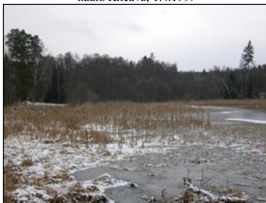
Obr. 16 Ruda, rybník Horní Kracle, 13.12.2009