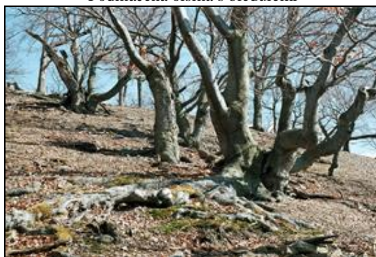
Obr. 12. Lánská obora, Jelení loužek, 7.4.2006