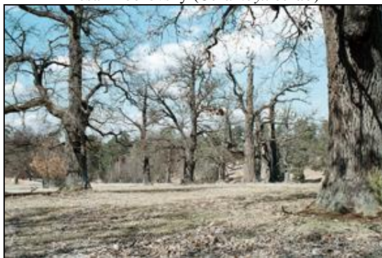
Obr. 19. Lánská obora, Myší díra, 7.4.2006