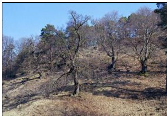
Obr. 22. Lánská obora, Myší díra, 7.4.2006. Pastervní les na svazích nad Piňským potokem u Kobylí hlavy