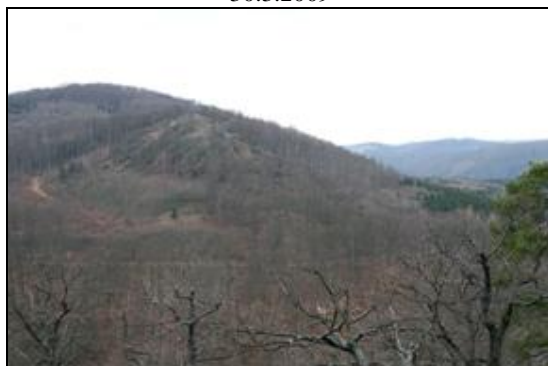
Obr. 46. Branov, NPR Velká Pleš, 30.3.2009. Pohled na Malou Pleš z vrchu Prachoviště