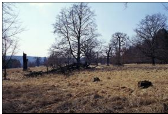
Obr. 26. Lánská obora, Liščina, 19.3.2003