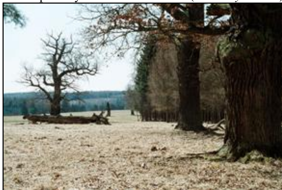
Obr. 23. Lánská obora, Liščina, pastervní les, 7.4.2006