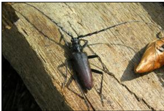
Obr. 17. Lánská obora, U Spáleného dubu, 8.5.2009. Tesařík obrovský ( Cerambyx cerdo )