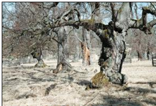
Obr. 20. Lánská obora, Myší díra, 7.4.2006