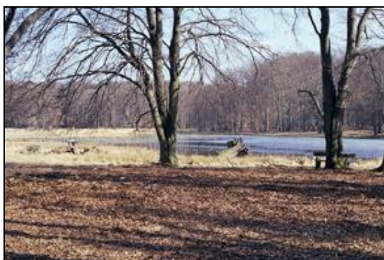
Obr. 37. Lánská obora, Kougľův rybník, 19.3.2003