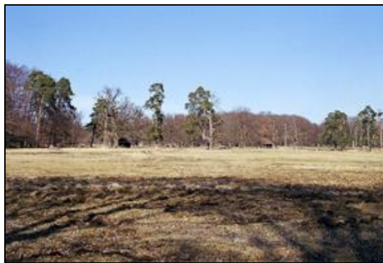
Obr. 34. Lánská obora, U Červené kůlny, 19.3.2003