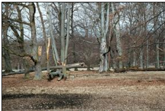
Obr. 33. Lánská obora, U Červené kůlny, 7.4.2006