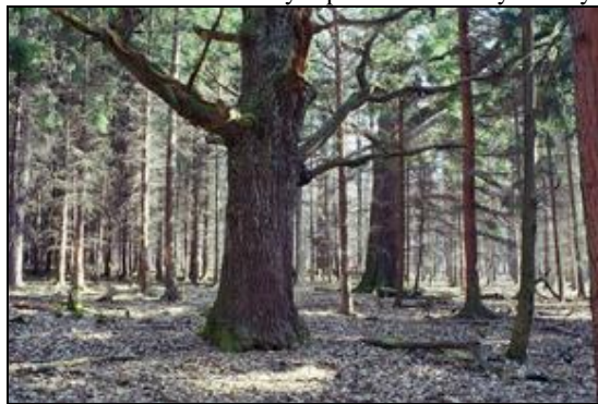
Obr. 24. Lánská obora, Liščina, 19.3.2003. Duby uprostřed smrkové plantáže