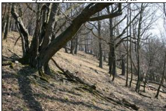
Obr. 27. Lánská obora, vrch Kocourová, suťový les, 31.3.2009