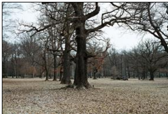
Obr. 18. Lánská obora, U Spáleného dubu, 7.4.2006