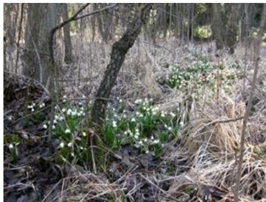
Obr. 10. Ruda, PR Prameny Klíčavy, 15.3.2008. Podmáčená olšina s bledulemi