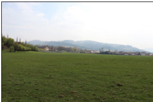
Obr. 11. Kysucký Lieskovec, údolí Kysuce, 13.4.2019