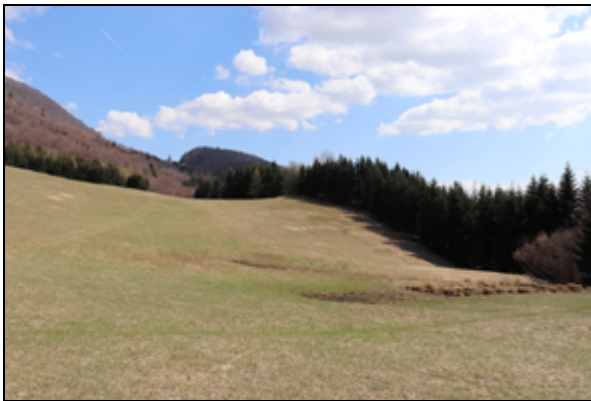
Obr. 5. Kľačno, prameny Nitry, 8.4.2019