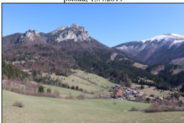
Obr. 15. Malá Fatra, Štefanová, 16.4.2019