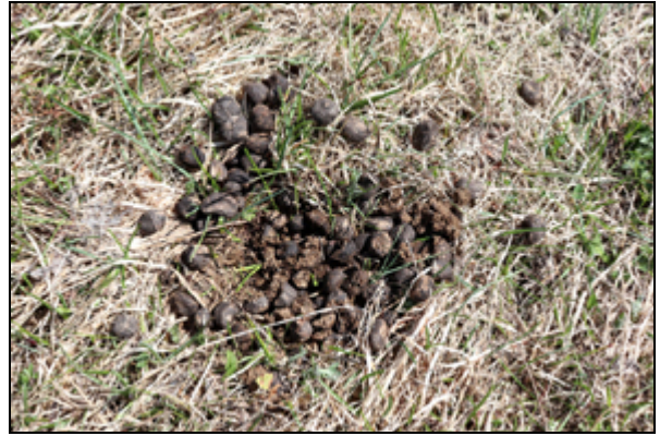
Obr. 4. Kľačno, vrch Reváň, 8.4.2019