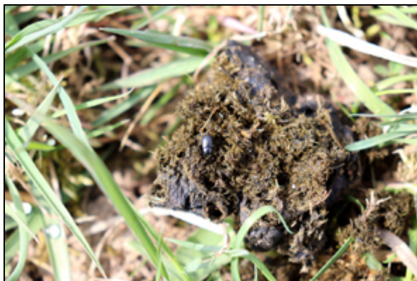
Obr. 12. Kysucký Lieskovec, Agrilinus ater , 13.4.2019