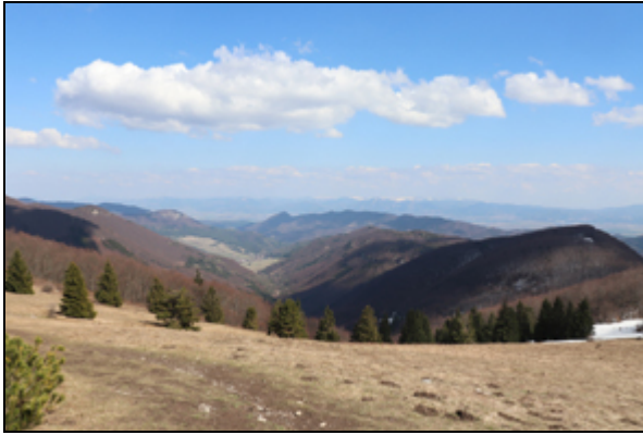
Obr. 3. Kľačno, vrch Reváň, 8.4.2019