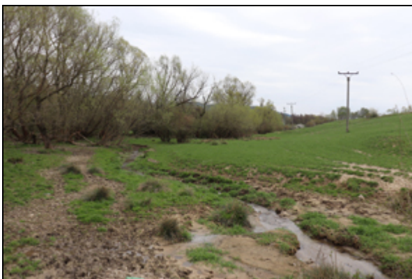
Obr. 9. Nitrianské Pravno, Hraničný potok, 12.4.2019