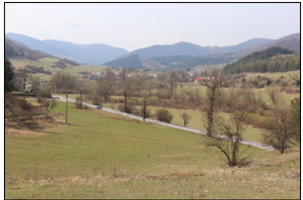
Obr. 6. Fačkov, Brockov potok a Rajčianka, 9.4.2019