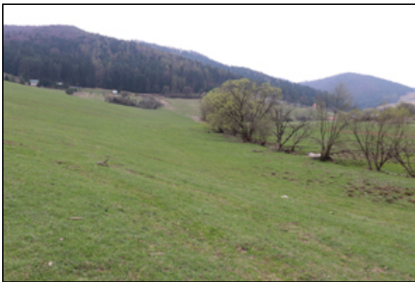
Obr. 7. Babkov, pastvina u kravína, 11.4.2019