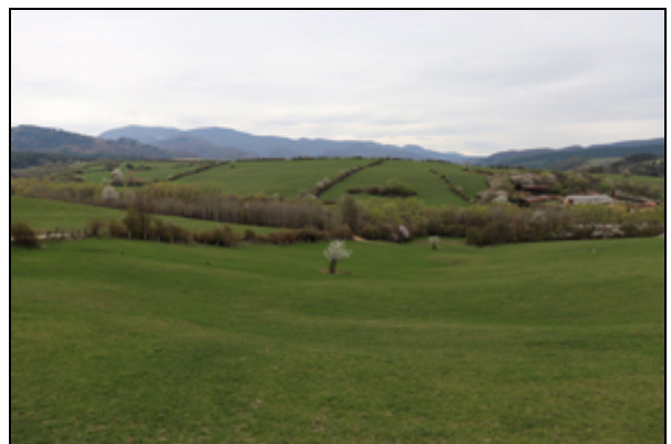
Obr. 10. Tužina, Hraničný potok, 12.4.2019