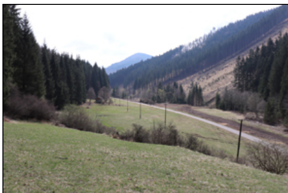
Obr. 14. Kamenná Poruba, dolina, 14.4.2019