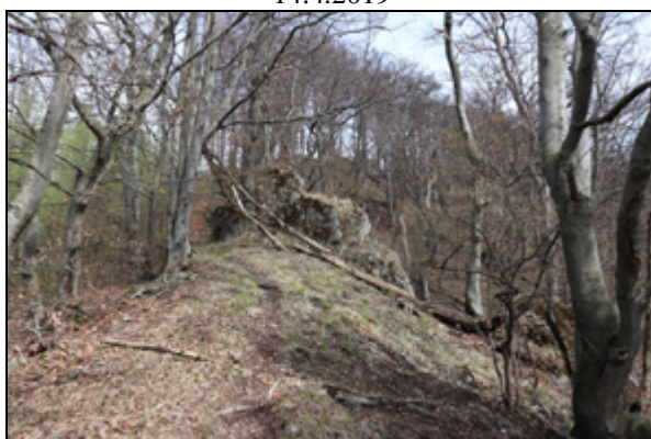
Obr. 18. Prenčín, vrch Dúpna, 17.4.2019