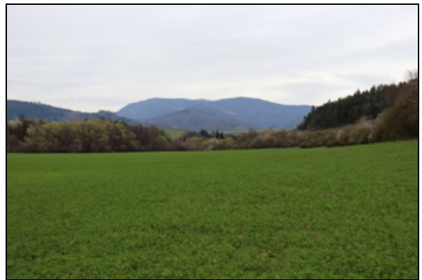
Obr. 8. Nitrianské Pravno, údolí Nitry, 12.4.2019