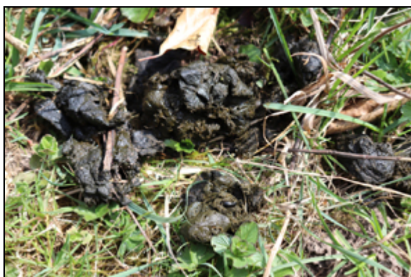
Obr. 16. Kamenná Poruba, dolina, Agrilinus ater , 14.4.2019