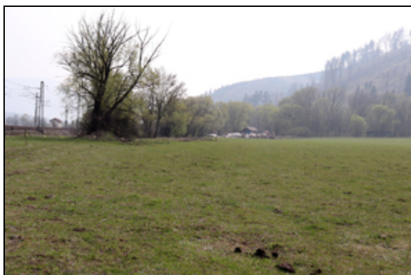
Obr. 13. Kysucké Nové Mesto, pastvina u Podhájskeho potoka, 13.4.2019