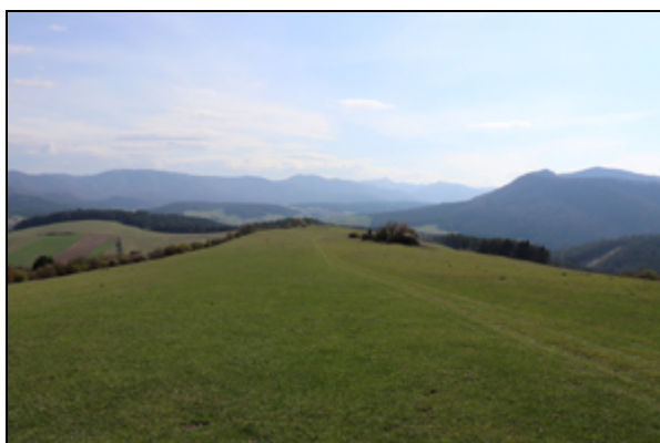
Obr. 17. Malé Ledenice, pastvina nad obcí, 17.4.2019