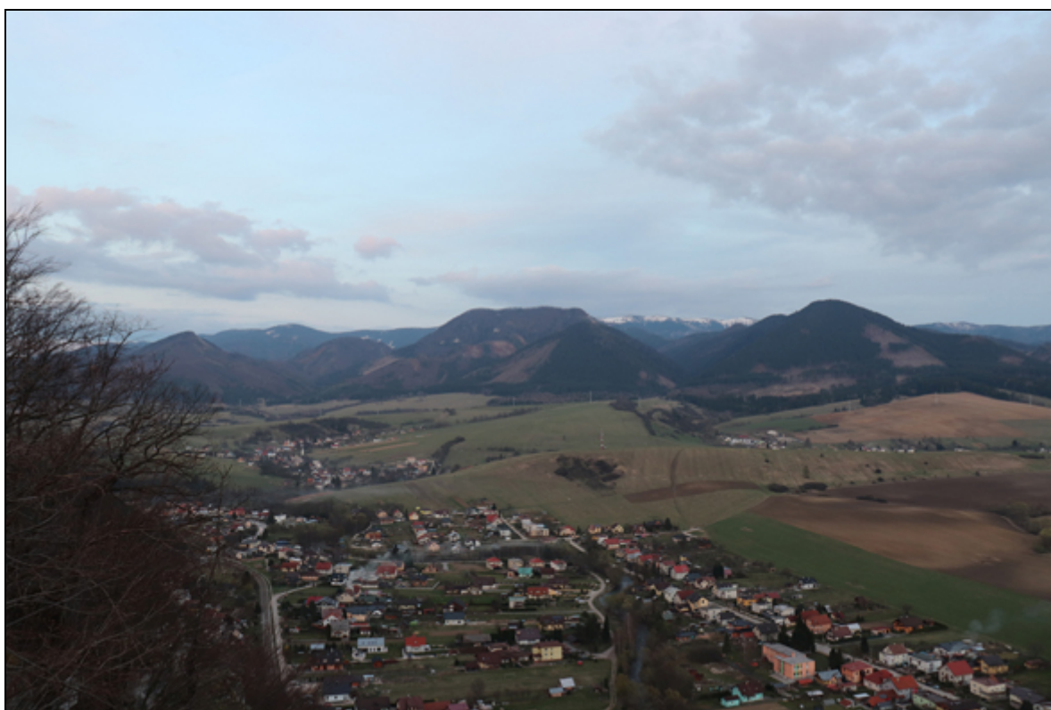
Obr. 2. Rajecské Teplice, 7.4.2019. Pohled z vrchu Skalky na Martinské hole.